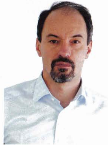
arh. Șerban Țigănaș, președintele Ordinului Arhitecților din România